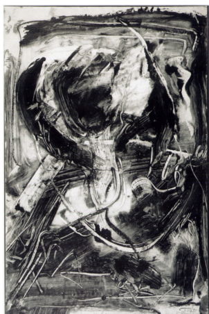
Emilio Vedova, Oltre , 1990

Filiberto Menna definisce questo fenomeno "Nuova Pittura" in quanto presuppone da parte dell'artista una progettualità in opposizione alla precedente totale libertà dell'Informale. Nel 1975 Menna ufficializza il suo pensiero pubblicando "La linea analitica dell'arte moderna", testo di riferimento per questa linea di ricerca che, recepita a livello transnazionale, viene denominata Pittura Analitica.